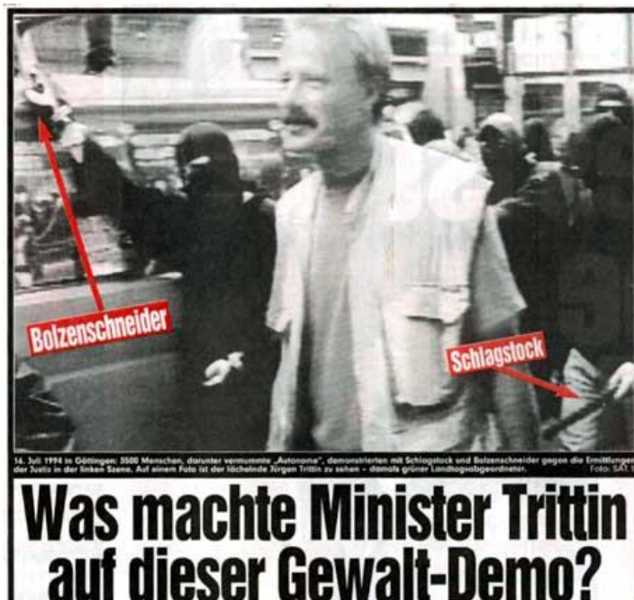
Abbildung 1: Quelle: BILD

http://cdn4.spiegel.de/images/image-607363-galleryV9-hcpm-607363.jpg